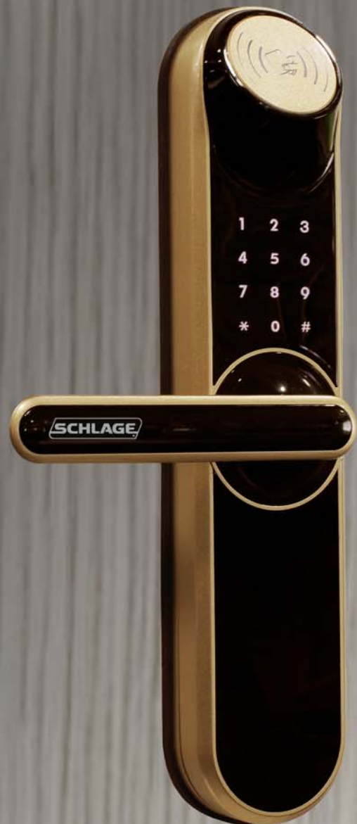
Champagne Gold SEL-2.0-FP-PG

Electronic Anti-Burglary Lock Real Security Sets You Free.